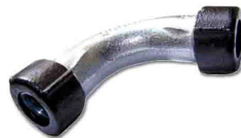
QW з'єднувач коліно