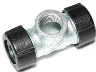
QT з'єднувач з відводом