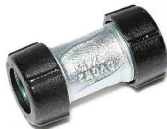
QO з'єднувач двосторонній