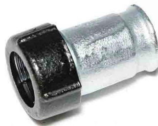
QI з'єднувач із внутрішньою різьбою