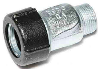
QA з'єднувач із зовнішньою різьбою