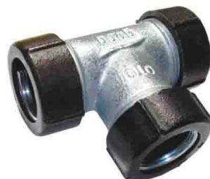
QTO з'єднувач трійник