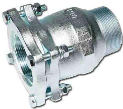
AF з'єднувач із зовнішньою різьбою