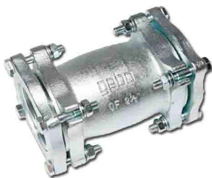
OF двосторонній з'єднувач