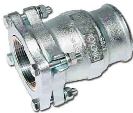
IF з'єднувач із внутрішньою різьбою