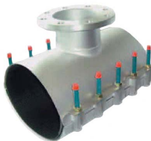
UNIFIX MAXI 2 з фланцевим відводом