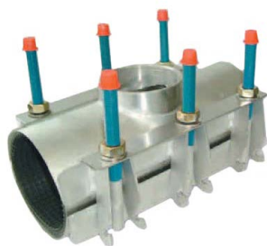
UNIFIX MAXI 2 з відводом