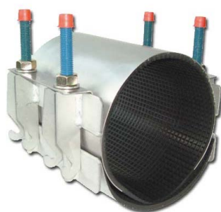
UNIFIX MAXI 2