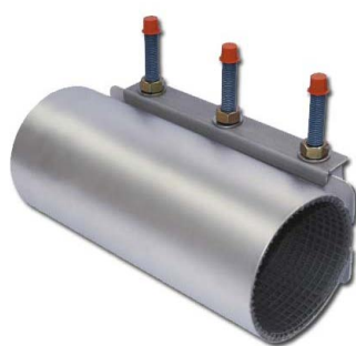
UNIFIX MAXI 1

Ремонтні хомути UNIFIX - це еластичні хомути, які складаються з однієї або ж кількох затискних секцій з нержавіючої сталі з резиною. Хомути призначені для ліквідації будь-якого типу пошкоджень та з'єднань всіх видів труб. Змінні болти з нержавіючої сталі, можливість застосування резини типу SBR, NBR та EPDM. Установка не потребує застосування спеціального обладнання. Для здійснення установки достатньо звичайного ключа.