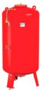
Дополнительные баки Flexcon M-K