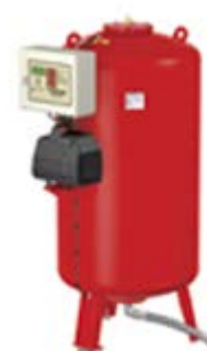
Компрессорный расширительный автомат Flexcon M-K/S