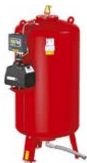
Компрессорный расширительный автомат Flexcon M-K/U

Мы производим широкий ассортимент моделей с лучшими характеристиками эффективности и гибкости, которые могут быть расширены за счет дополнительных принадлежностей. Модульная и адаптируемая линейка продукции Flamco соответствует всем возможным требованиям к этому типу оборудования.