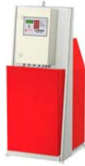
Насосы Flexcon MPR-S