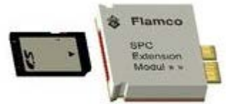
Дополнительные блоки управления