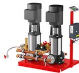
Flamcomat – насосные агрегаты