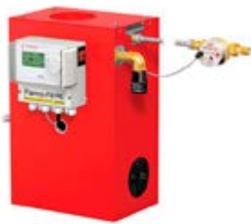
Принадлежности для заполнения системы