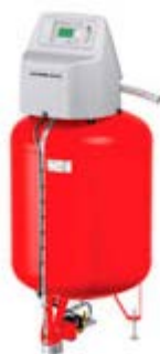
Компрессорный расширительный автомат Flexcon M-K/C