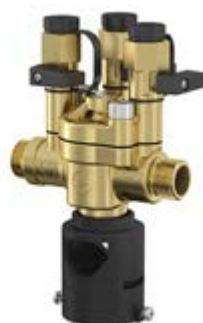
Дополнительные принадлежности для автоматов